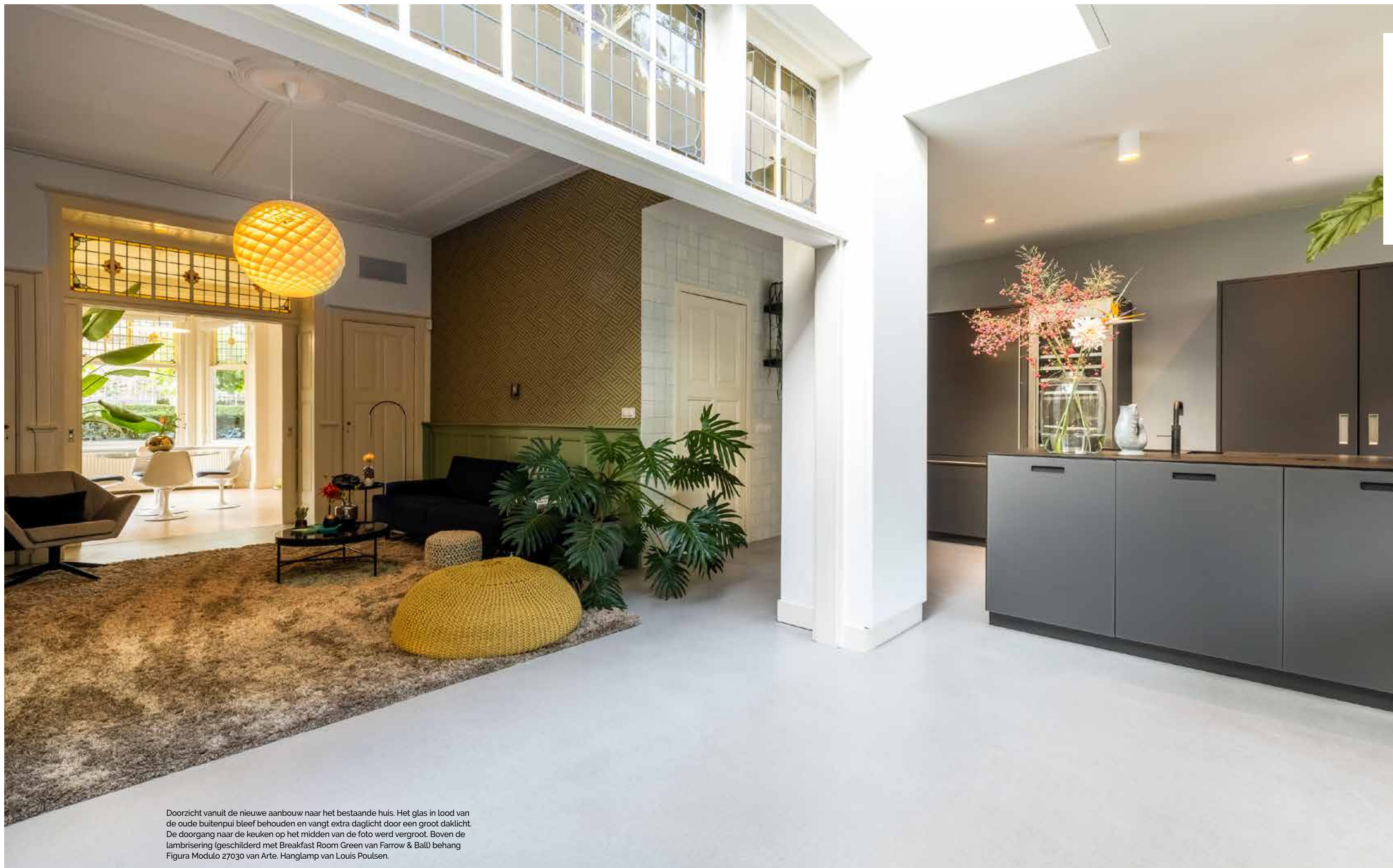
Doorzicht vanuit de nieuwe aanbouw naar het bestaande huis. Het glas in lood van de oude buitenpui bleef behouden en vangt extra daglicht door een groot daklicht. De doorgang naar de keuken op het midden van de foto werd vergroot. Boven de lambrisering (geschilderd met Breakfast Room Green van Farrow & Ball) behang Figura Modulo 27030 van Arte. Hanglamp van Louis Poulsen.