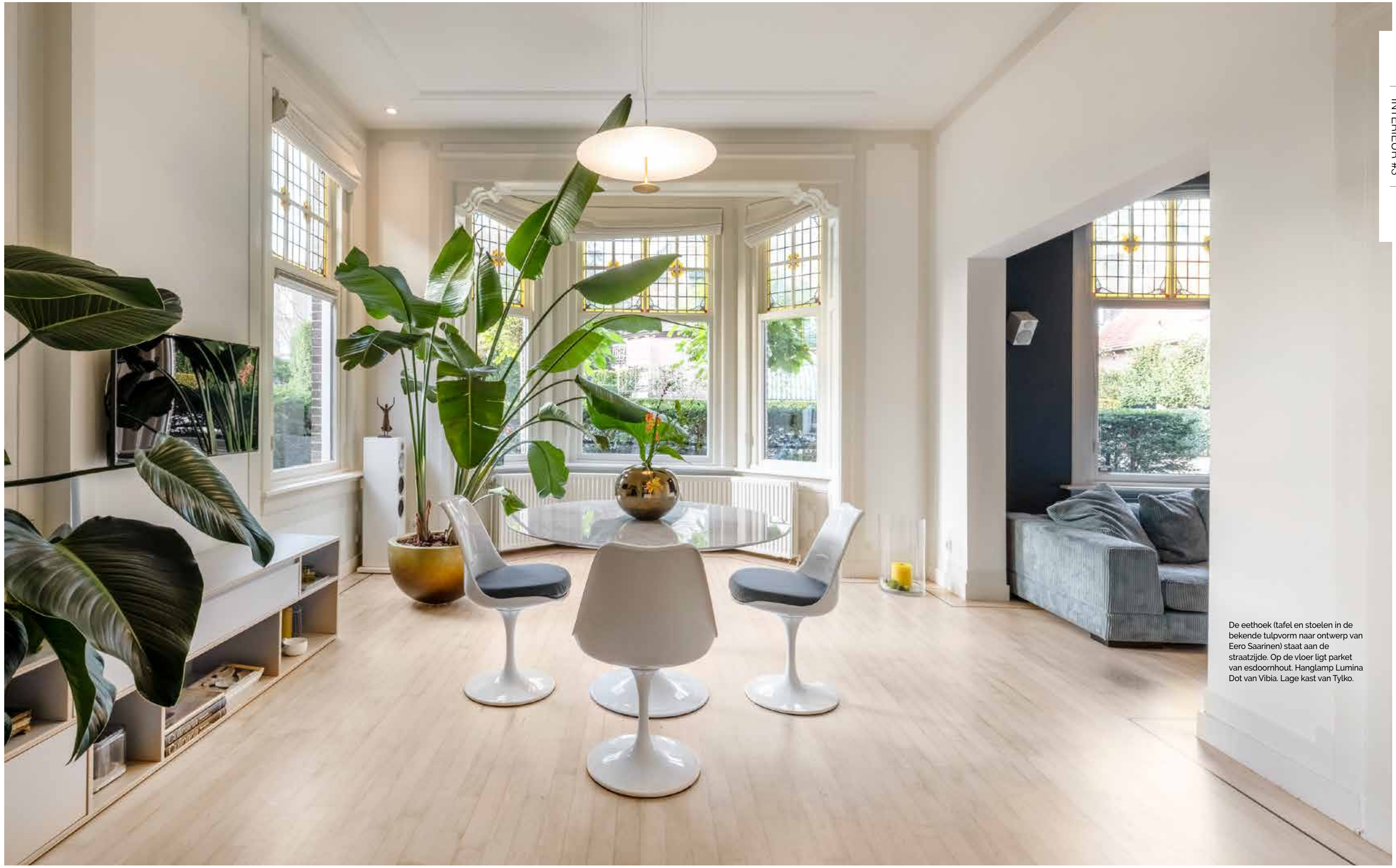
De eethoek (tafel en stoelen in de bekende tulpvorm naar ontwerp van Eero Saarinen) staat aan de straatzijde. Op de vloer ligt parket van esdoornhout. Hanglamp Lumina Dot van Vibia. Lage kast van Tylko.