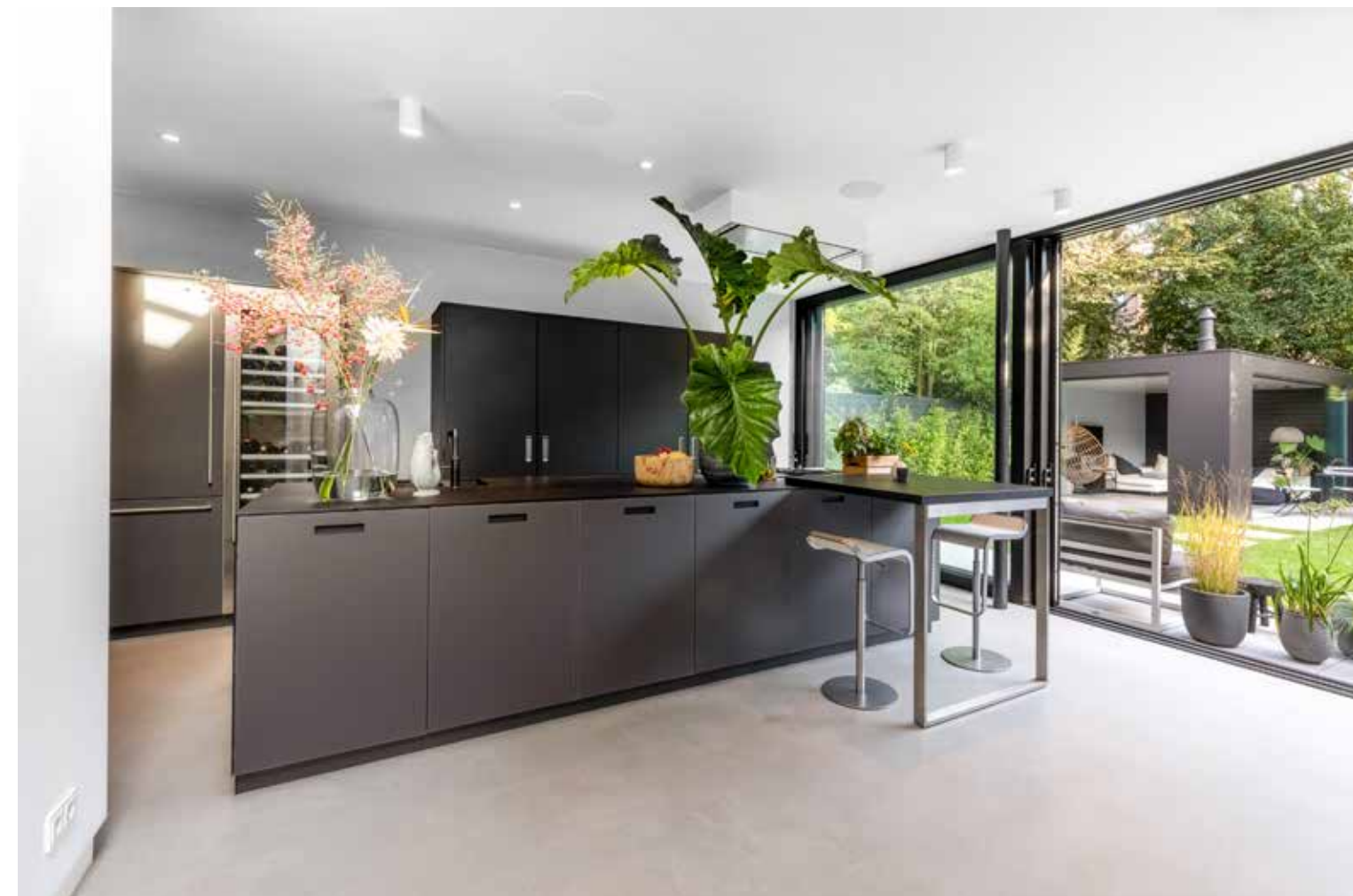
De keuken in de nieuwe aanbouw bestaat uit een groot eiland en een enorme kastenwand met apparatuur. De keuken is van Next 125 met deuren in lavazwart matglas en satijnlak. Apparatuur van Gaggenau. Kraan Square van Quooker. Inbouwverlichting Rony en opbouwverlichting Solid van Wever & Ducre. Vloer Superquartz in kleur Zinc Bardiglio van Senso. Barkrukken Lem van Lapalma. LINKS De nieuwe aanbouw bestaat aan de achterkant alleen maar uit glas.